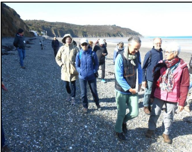
5 : En route vers le rocher du Poissonnet