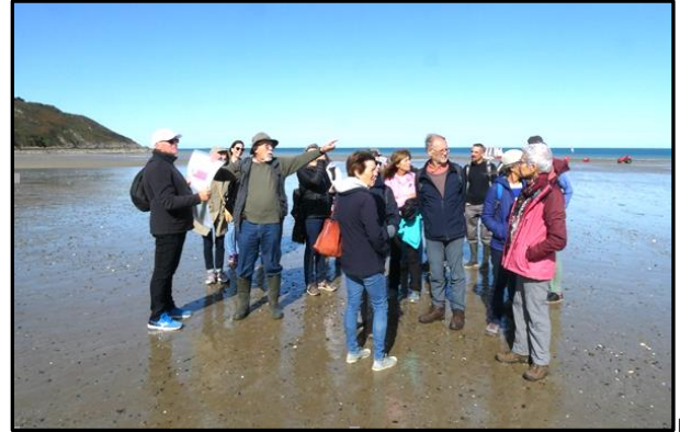
2 Le Rocher du Poissonnet c'est par là !