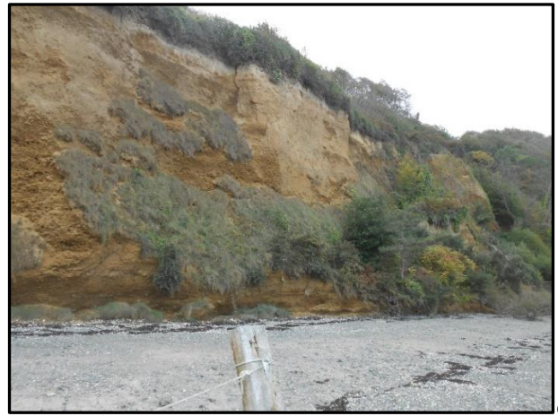
31 : Pan de falaise de loess en voie d'éboulement