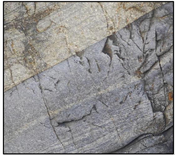
8 : Lamines dans les bancs de grès et de pélites