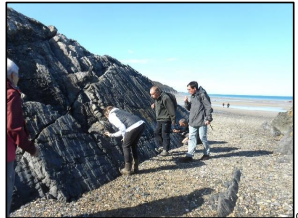
12 : Surface de banc