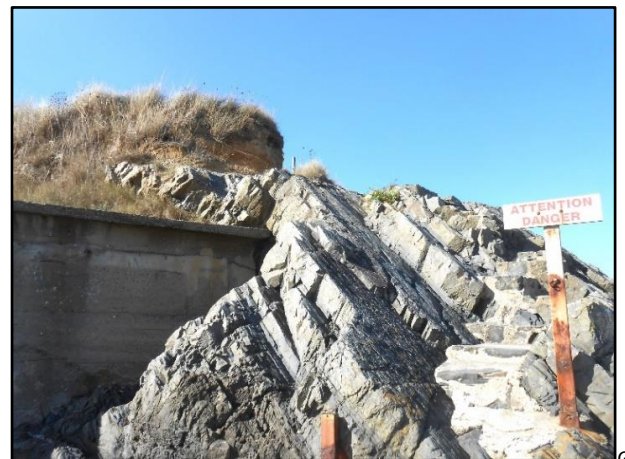
6 : Rocher du Poissonnet