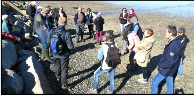
1 Explications préliminaires