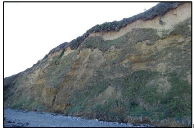
4 : Falaises de Loess