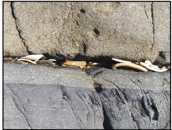
10 : Contact banc de grès et banc de pélites