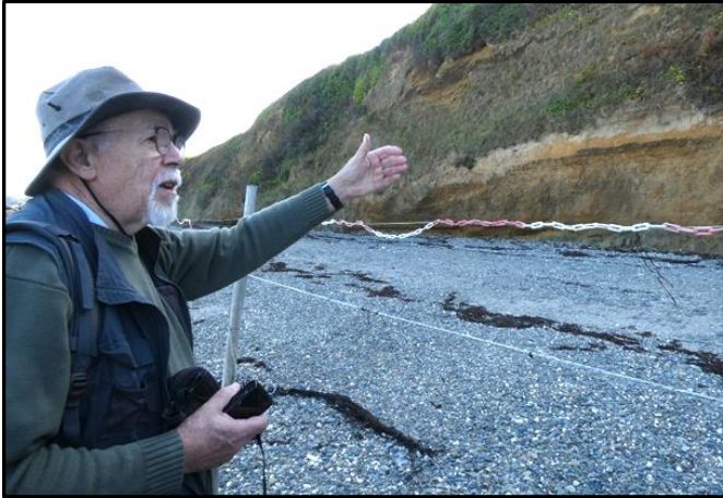
3 : Les falaises de loëss