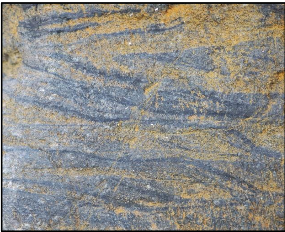
11 : Slump (glissement, séisme ?) dans un banc