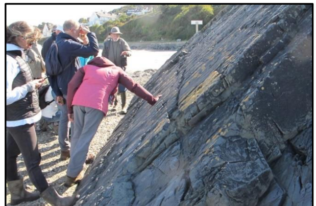
14 : surface de banc