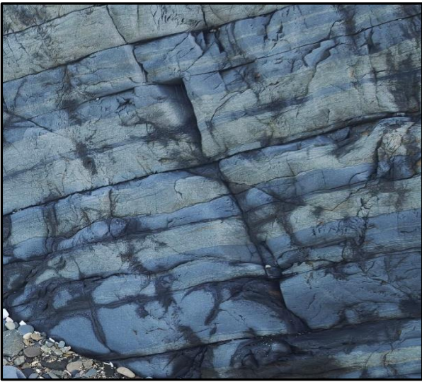
7 : Alternances de bancs de grès clairs et de pélites sombres