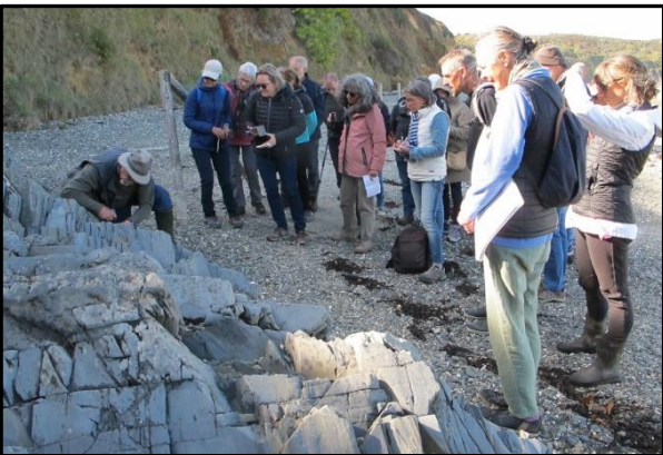
9 : Examen des bancs sédimentaires