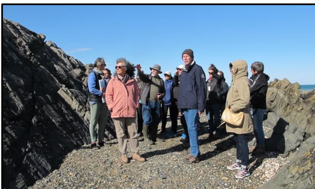
13 : le groupe au Rocher du Poissonnet