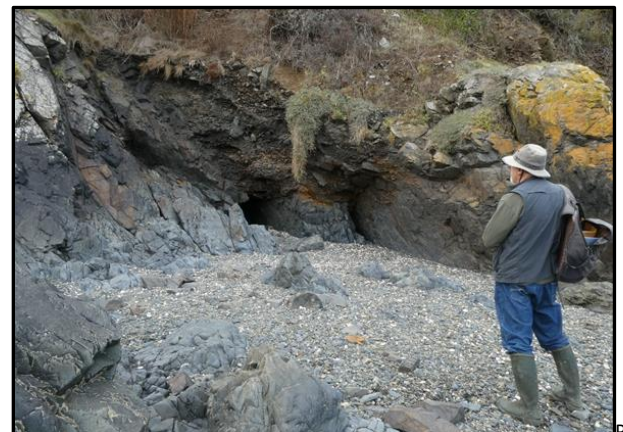
28 : Sur le retour