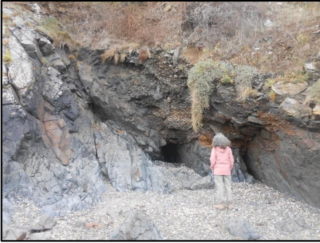
30 : Paleo-ravin comblé par du head quaternaire