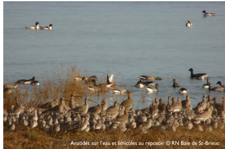
Anatidés sur l'eau et limicoles au reposoir

L'année 2020 a été marquée par les nombreuses infractions constatées dans le périmètre de la réserve naturelle, notamment au moment des déconfinements. Pour accompagner au mieux l'accroissement de la fréquentation, mais aussi améliorer l'appropriation de la réglementation du site, VivArmor Nature a mobilisé un groupe de bénévoles « ambassadeurs de la baie » durant la saison estivale. Leur mission : aller à la rencontre des visiteurs pour expliquer les richesses, la sensibilité et la réglementation du site. Plébiscitée par les bénévoles et les visiteurs, cette démarche sera étendue à toutes les vacances scolaires en 2021. Les chantiers d'entretien courants (collecte de déchets, arrachage d'invasives...) ont été menés, avec un appui bénévole restreint en raison de la crise sanitaire.