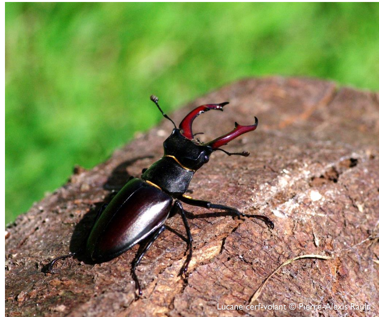
Lucane cerf-volant

Après la Flore, les Mammifères, les Oiseaux, les Invertébrés continentaux et les Poissons migrateurs, c'est au tour des Amphibiens et Reptiles de bénéficier d'un observatoire régional. Mandatées par le Conseil régional et les services de l'État en région, Bretagne Vivante et VivArmor Nature ont activement travaillé en 2020 à la construction et au lancement de cet outil qui vise à améliorer la connaissance et la prise en compte des Amphibiens et Reptiles à l'échelle régionale. L'année 2020 a été principalement consacrée à la structuration de l'observatoire et des réseaux associés.