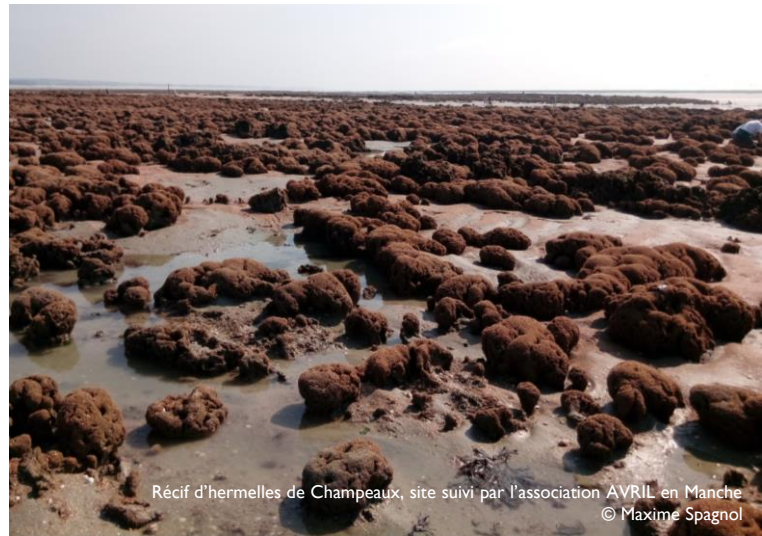
Récif d'hermelles de Champeaux, site suivi par l'association AVRIL en Manche

Rendez-vous sur www.pecheapied-loisir.fr .