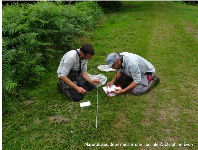
Naturalistes déterminant une libellule

Depuis 2017, VivArmor Nature anime un atelier botanique se réunissant tous les 15 jours. Grâce à des cours en salle et des prospections sur le terrain, les membres se forment à la détermination de la flore. Compte-tenu de l'engouement pour cette formule, l'association a souhaité étendre ces rendez-vous de formation aux fondamentaux de l'écologie et à d'autres groupes taxonomiques (Vers de terre, Amphibiens, Reptiles, Insectes et Algues), en créant une Université de la Nature. 80 rendez-vous sont ainsi programmés sur 2 ans (2021-2022).