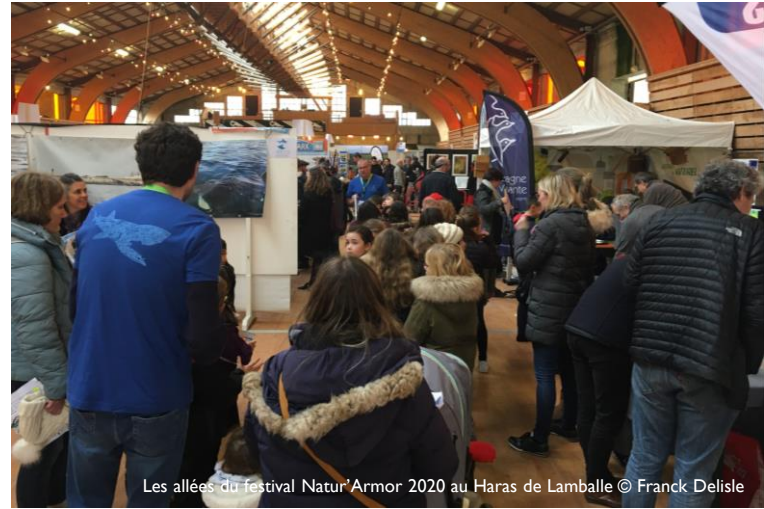
Les allées du festival Natur'Armor 2020 au Haras de Lamballe