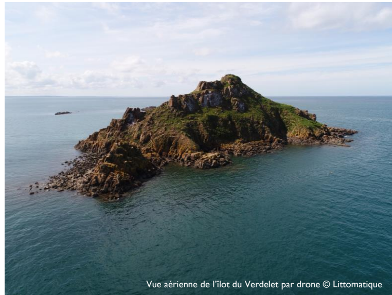
Vue aérienne de l'îlot du Verdelet par drone

En 2020, l'association a travaillé à l'élaboration de nouveaux panneaux afin d'améliorer l'information des visiteurs et proposé à la commune de faire évoluer la réglementation du site pour mieux protéger la colonie. A compter de 2021, lors des grandes marées donnant accès à l'îlot, VivArmor Nature mobilisera un groupe de bénévoles « ambassadeurs du Verdelet » afin de sensibiliser les promeneurs aux bonnes pratiques permettant de préserver la colonie d'oiseaux.