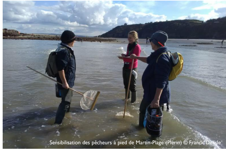
Sensibilisation des pêcheurs à pied de Martin-Plage (Plérin)

sur www.vivarmor.fr / rubrique Pêche à pied